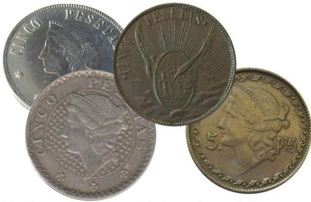
Fichas sin marca de fabricante con idénticos motivos que Guillen Hermanos.

sociedades recreativas de España, también acuño unas fichas muy particulares de plata y baquelita como las del Círculo Industrial de Alcoy . La otra fábrica que hemos comentado es la de Luis Farinetti una casa fundada a finales de siglo XIX dedicada a la elaboración de sellos, grabados, imprentillas, medallas y fichas metálicas. Entre los catálogos de la época de dicha casa hemos podido comprobar que acuño fichas, muchas de ellas para comercios valencianos, entre los que destacan el círculo valenciano, sociedad cooperativa obrera “el progreso” del cabañal, fabrica el Carmen , por citar algunos ejemplos.