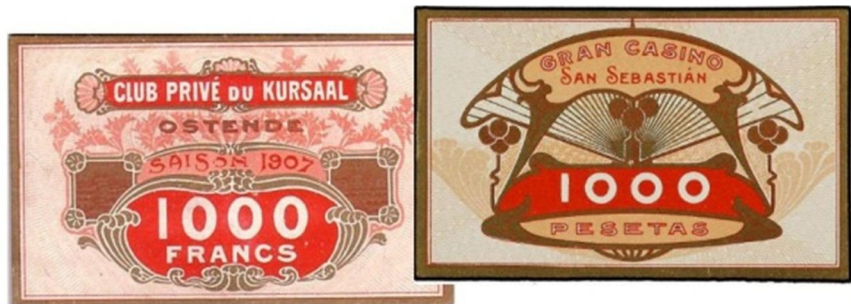
Ficha del Kursaal Ostende y Gran Casino de San Sebastian