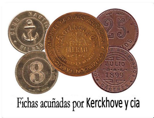
Fichas acuñadas por Kerckhove y cia

Anuncio de la época y jeton publicitario de Plata Serrano